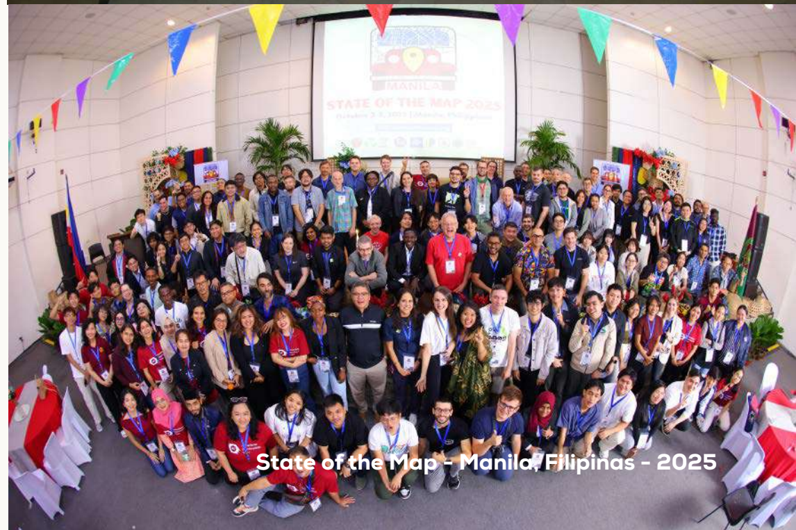
State of the Map - Manila, Filipinas - 2025