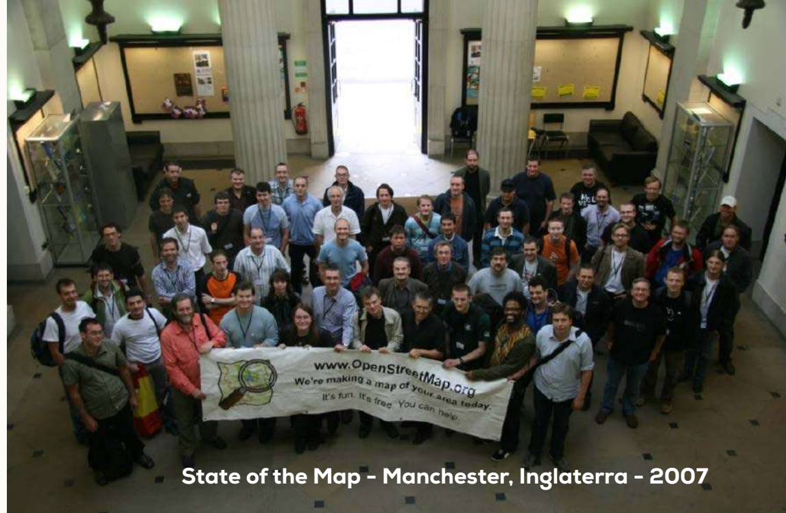
State of the Map - Manchester, Inglaterra - 2007

Wiki: wiki.openstreetmap.org/wiki/State_of_the_Map Web: stateofthemap.org